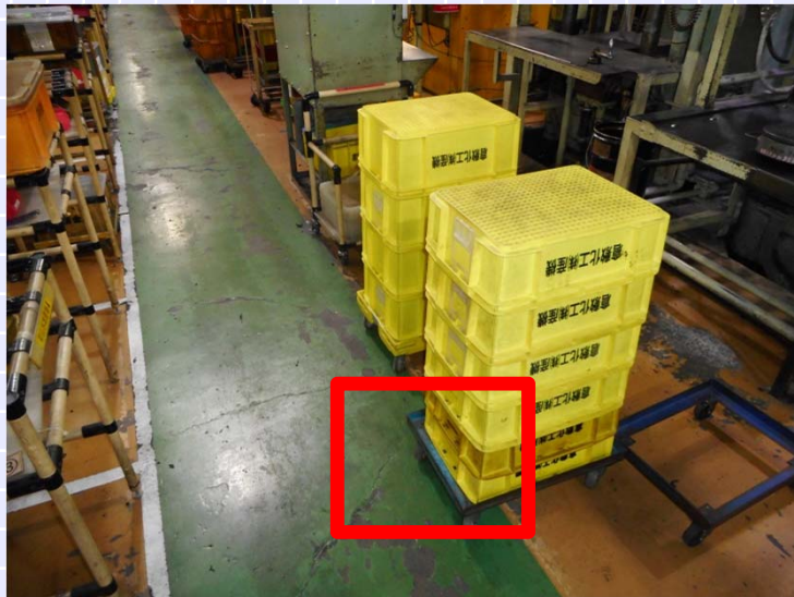
改善前(かいぜんまえ)

改善前は、置場が決まってなく、はみ出し、タテ・ヨコ・ナナメが揃っていなかった。 置場を定置化することで改善できた。