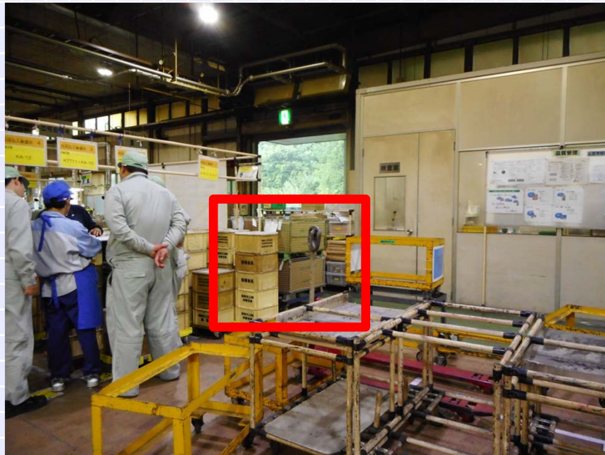
改善前(かいぜんまえ)